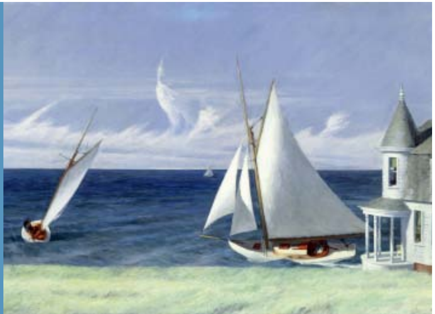
Edward Hopper: Lee Shore (1941), Öl auf Leinwand, 71.8 x 109.2 cm, The Middleton Family Collection © Heirs of Josephine Hopper / 2019, ProLitteris, Zürich