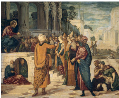
Jacopo Tintoretto und Werkstatt, Christus und die Ehebrecherin, um 1547–1549, Öl auf Leinwand, 160 x 225 cm, Rijksmuseum Amsterdam