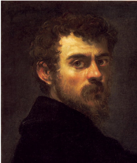
Jacopo Tintoretto, Selbstporträt, um 1547, Öl auf Leinwand, 45 x 38 cm, Philadelphia Museum of Art