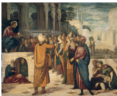
Jacopo Tintoretto und Werkstatt, Christus und die Ehebrecherin, um 1547-1549, Öl auf Leinwand, 160 x 225 cm, Rijksmuseum Amsterdam © gemeinfrei