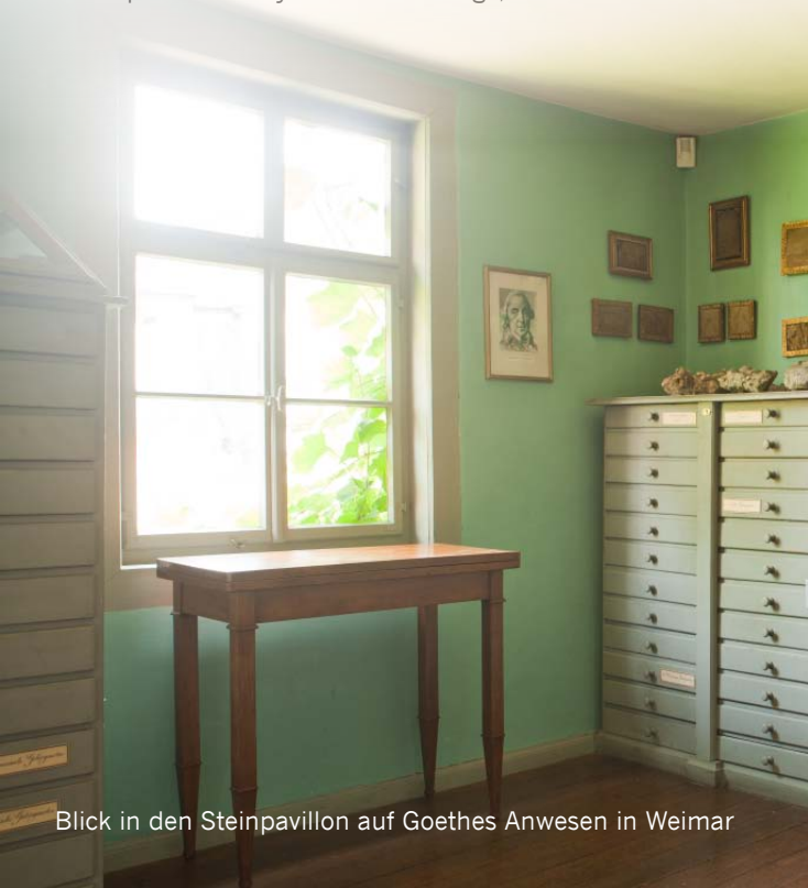
Blick in den Steinpavillon auf Goethes Anwesen in Weimar

„Was bedeutet Freiheit – für den Einzelnen und innerhalb eines politischen Systems? Eine Frage, die Beethoven in